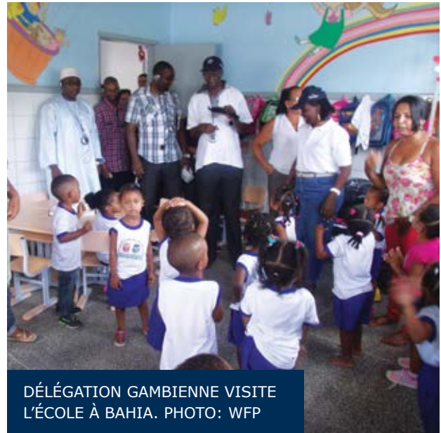
DÉLÉGATION GAMBIIENNE VISITE L'ÉCOLE À BAHIA.

Une délégation de la Tunisie avec des représentants des ministères de l'Éducation, de l'Agriculture, des Questions Sociales, de la Santé et des Relations Internationales, outre de membres du Bureau de Pays du PAM en Tunisie, a été au Brésil du 23 au 30 avril pour une visite d'études, organisée par le Centre d'Excellence contre la Faim. La visite a été ciblée principalement sur l'expérience brésilienne de l'alimentation scolaire, étant donné que la Tunisie est intéressée à revoir son programme national d'alimentation scolaire, pour développer et adopter un modèle plus durable. Les neuf membres de la délégation ont participé de réunions avec les représentants des principales institutions brésiliennes concernées par le PNAE et à d'autres initiatives de protection sociale, outre de visites sur le terrain qui ont inclus des banques d'aliments, des restaurants communautaires, des écoles et des propriétés agricoles.