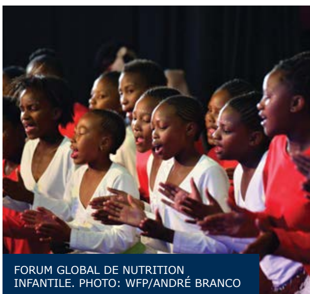
FORUM GLOBAL DE NUTRITION INFANTILE.