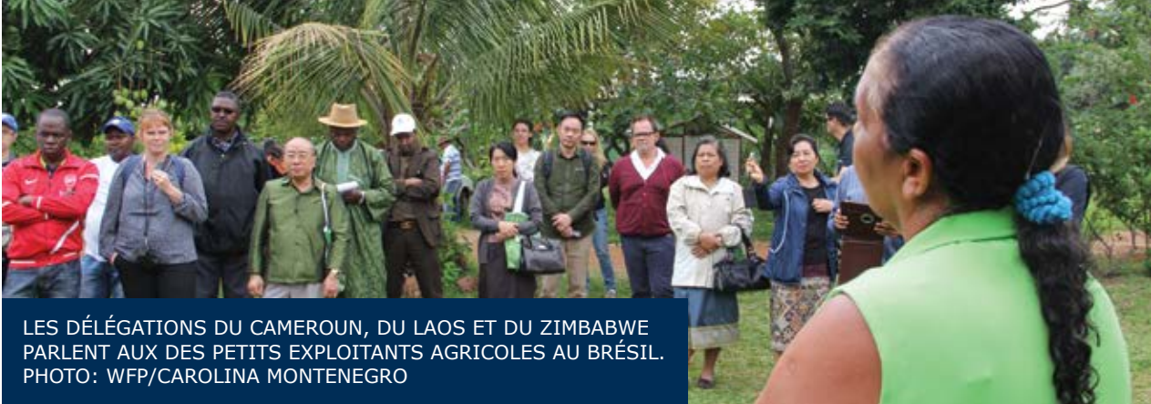
LES DÉLÉGATIONS DU CAMEROUN, DU LAOS ET DU ZIMBABWE PARLENT AUX DES PETITS EXPLOITANTS AGRICOLES AU BRÉSIL.