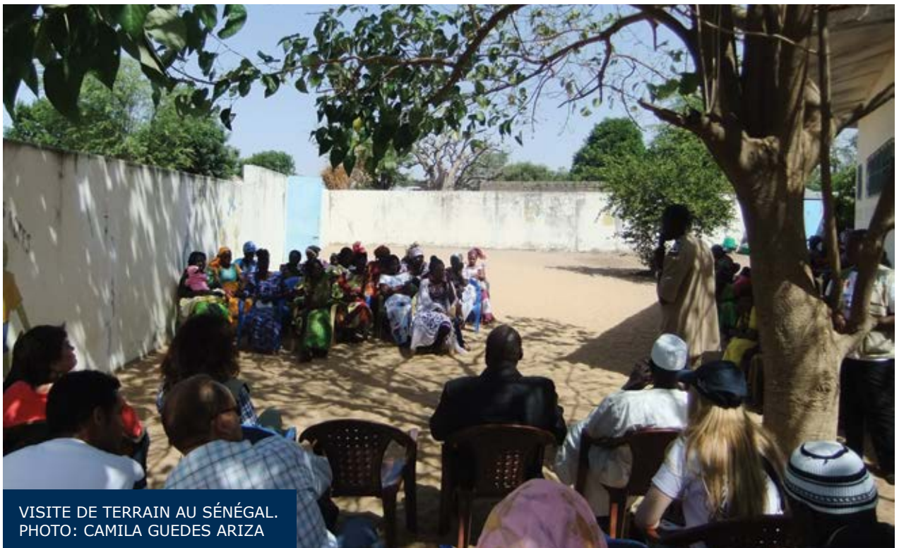
VISITE DE TERRAIN AU SÉNÉGAL.

Impact: L’atelier a été un moment important de mobilisation des principaux acteurs concernés par l’alimentation scolaire autour de la stratégie tracée au Brésil. Ont participé des représentants des ministères de la Planification, de l’Éducation, de l’Agriculture, des Finances, du Budget, entre autres, y compris les ministres de la Planification et de l’Éducation.