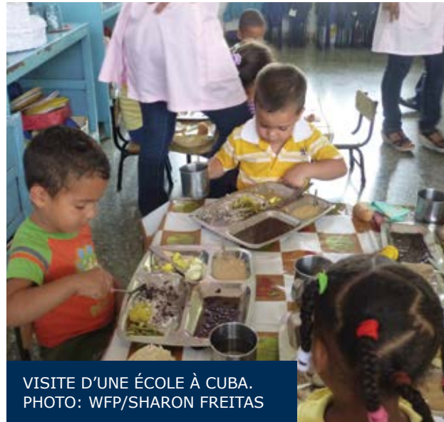
VISITE D'UNE ÉCOLE À CUBA.

Après la visite d'études, le Centre a appuyé l'embauche d'une consultante pour appuyer le gouvernement du Niger dans l'élaboration d'un plan de mise en œuvre