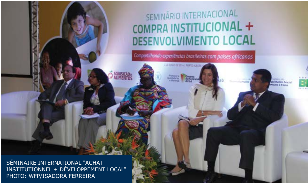
SÉMINAIRE INTERNACIONAL "ACHAT INSTITUTIONNEL + DÉVELOPPEMENT LOCAL"

5. Analyse de coût-bénéfice et du modèle d'investissement, en se concentrant sur les effets multiplicateurs d'un programme d'alimentation scolaire lié à l'agriculture familiale.