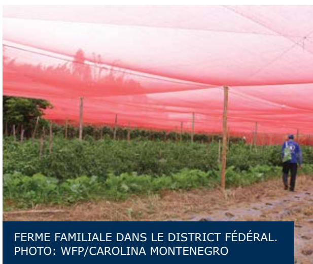
FERME FAMILIALE DANS LE DISTRICT FÉDÉRAL.

Du 24 novembre au 5 décembre, le Centre d'Excellence contre la Faim a réalisé une visite d'études pour les délégations du Cameroun, du Laos et du Zimbabwe. La visite d'études a commencé à Bahia et a terminé dans le District Fédéral et a été une opportunité pour les pays participants de connaître les initiatives brésiliennes de combat à la faim et à la pauvreté et pour échanger des expériences entre eux.