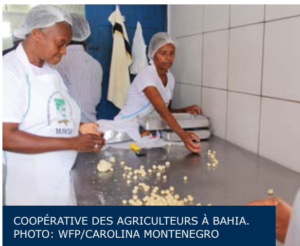
COOPÉRATIVE DES AGRICULTEURS À BAHIA.

"Ici nous voyons qu'il est possible de connecter l'alimentation scolaire et l'agriculture familiale. Au Laos, nous devons encore renforcer la capacité des communautés, fournir des graines de qualité et l'appui technique aux familles".