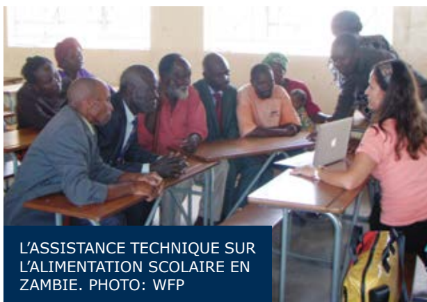
L'ASSISTANCE TECHNIQUE SUR L'ALIMENTATION SCOLAIRE EN ZAMBIE.

novembre. Avec la collaboration du bureau de pays du Programme Alimentaire Mondial, la transition du programme d'alimentation scolaire pour le modèle d'achats locaux est en train de devenir une réalité.