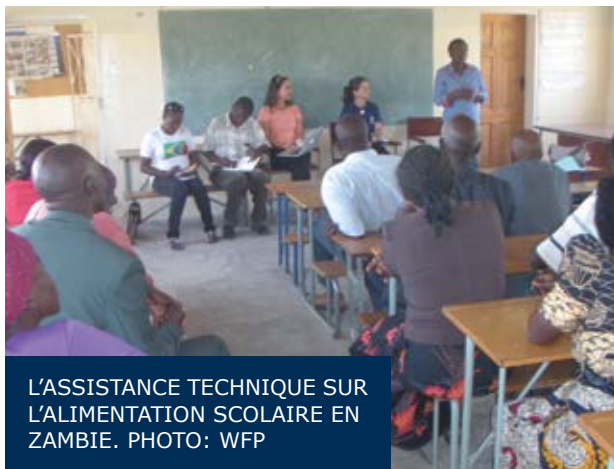
L'ASSISTANCE TECHNIQUE SUR L'ALIMENTATION SCOLAIRE EN ZAMBIE.

Impact: Le ministère de l'Éducation de la Zambie a demandé l'appui du Centre d'Excellence contre la Faim pour la mise en œuvre dans le pays d'un programme d'alimentation scolaire avec l'usage d'aliments produits localement. Une mission de consultation du Centre en Zambie a eu lieu du 11 au 21